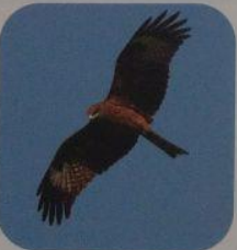
Black Kite 黑鳶(麻鷹)